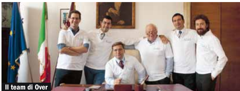
Il team di Over