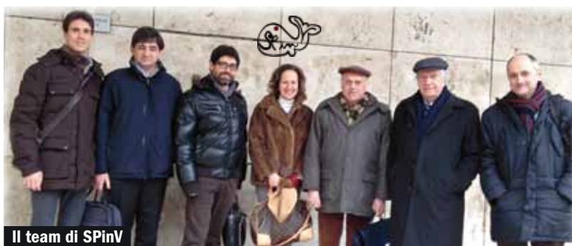
Il team di SPinV